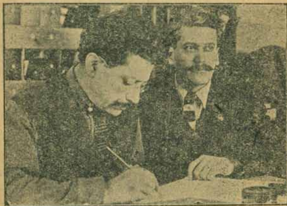
Ricardo y Enrique Flores Magón en la cárcel de Los Angeles, Cal., en 1916