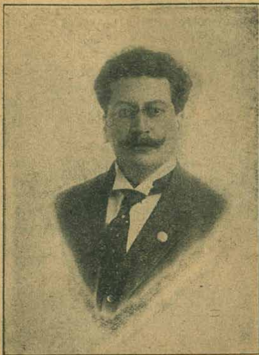
Ricardo Flores Magón en 1911

sus crímenes y sus traiciones con la misma energía que antes lo había hecho respecto de Díaz. Es verdad: los grupos insurreccionales adictos comenzaron a decrecer y desaparecer, ultimados por la superioridad de las fuerzas enemigas; pero la divisa de Tierra y Libertad quedó en la conciencia de