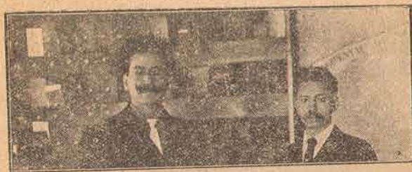
Ricardo Flores Magón y Librado Rivera en la cárcel de Los Angeles, Cal., en 1918

La vida en Leavenworth es una continua tragedia; no sólo no mejoró la salud, sino que fue empeorando, y a su malestar se añadió poco después una afección visual que