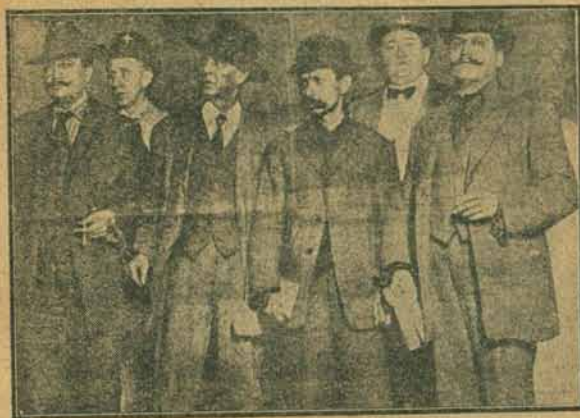
De izquierda a derecha: Ricardo Flores Magón, Anselmo L. Figueroa, Librado Rivera y Enrique Flores Magón, bien esposados, conducidos a la penitenciaría de McNeil Island por los esbirros que aparecen atrás marcados con una cruz

pertenecían todos al elemento de más baja estatura moral, comprados por el Gobierno mexicano. Los testimonios favorables fueron casi todos rechazados, y los rebeldes, Ricardo y Enrique Flores Magón, Librado Rivera y Anselmo L. Figueroa fueron condenados a 23 meses de prisión, pena expiada en la penitenciaría de la isla de McNeil, Estado de Washington. El Gobierno norteamericano tenía igualmente un gran interés en obstaculizar las actividades de