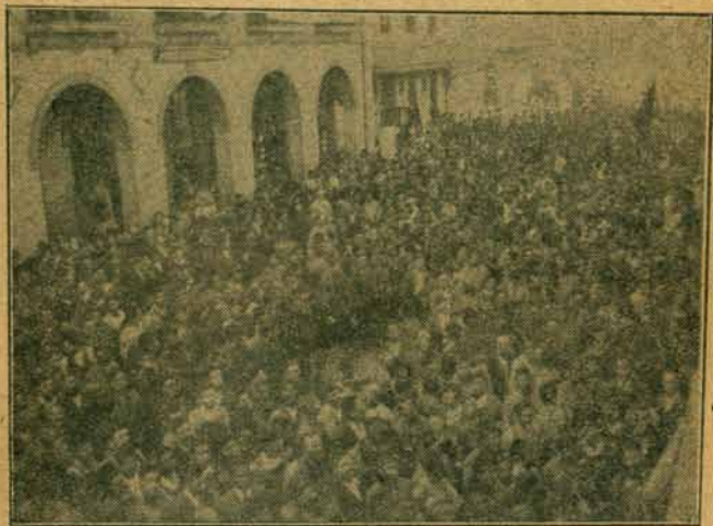
Aspecto de la manifestación de los trabajadores de Aguascalientes al llegar a esta ciudad el cadáver de Ricardo Flores Magón, que era conducido a México

“En lugar de pedir a ustedes algo de luto, algo de tristeza, algo de crespones negros, yo pidó un aplauso estruendoso, que los revolucionarios mexicanos, los hermanos de