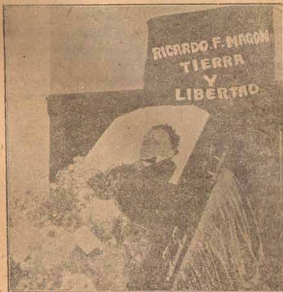
Cádafer de Ricardo Flores Magón, en Los Angeles, Cal., traído de Leavenworth

Flores Magón tenía poco más de cuarenta y ocho años de edad y había pasado más de trece en las diferentes prisiones de México y Estados Unidos.