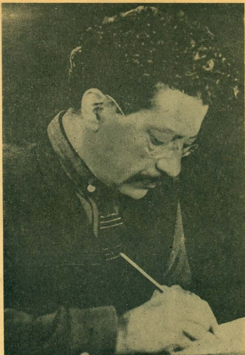
RICARDO FLORES MAGÓN, uno de los más fuertes promotores de la Revolución Mexicana, cínicamente calumniado por el porfirismo en Baja California, por venganza política