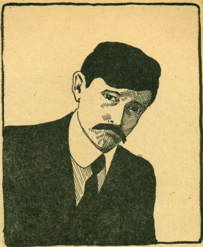
JOHN KENNETH TURNER, colaborador decidido y valiente de los mexicanos en su gesta libertaria, calumniado vilmente por los partidarios de la dictadura en Baja California