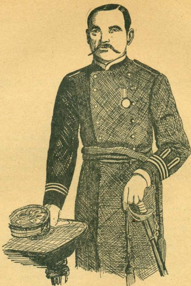
El Corl. CELSO VEGA, Jefe Político y Militar del Distrito Norte de Baja California en 1911, quien se valió de las mentiras del filibusterismo para disculpar su incapacidad militar para defender la región a él confiada por la dictadura porfirista